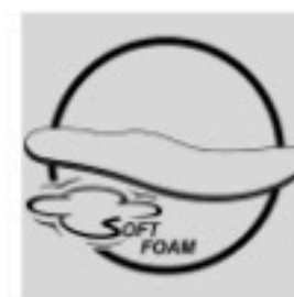
Soft Foam Insole