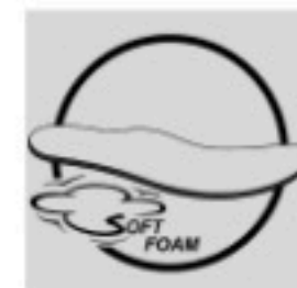
Soft Foam Insole